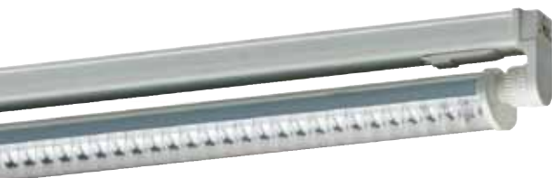
Réflecteur avec grille basse luminance. Reflector met laage luminantie rooster.